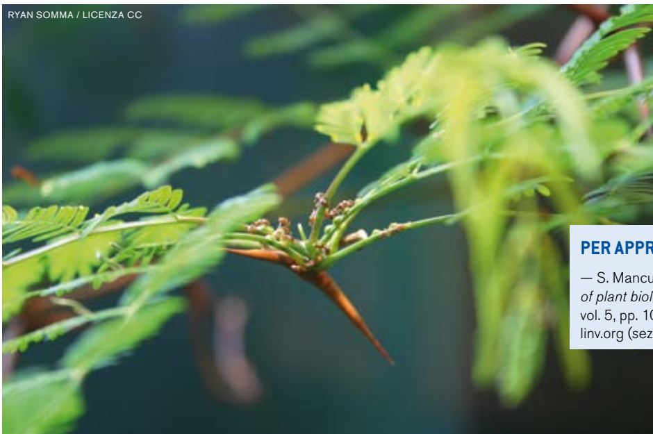
Formiche ( Pseudomyrmex ferruginea ) sulla piana mirmecofila Acacia cornigera .

Con questa ipotesi in mente, Delpino si mise al lavoro sul campo: in una prima indagine condotta tra Liguria e Toscana, il botanico descrisse ben 80 specie di piante mirmecofile, mentre in una monografia pubblicata nel 1886 elencò 3000 specie (in tutto il pianeta) in grado di secernere nettare extrafioreale, oltre a 130 specie capaci di attrarre formiche fornendo loro nidi o ripari. Egli inoltre osservò che effettivamente l'associazione con insetti e in particolare con formiche portava vantaggi concreti alle piante in termini di riduzione della pressione da parte di predatori: altro che rifiuti!